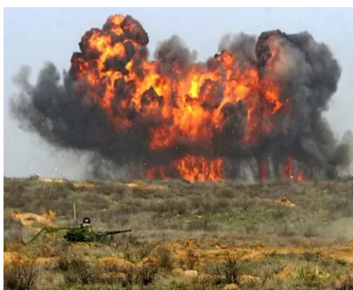
Рисунок 2 Визуальный факел взрыва

Завершая рассмотрение вопроса влияния на атмосферу взрывчатых веществ, необходимо заметить, что их суммарная