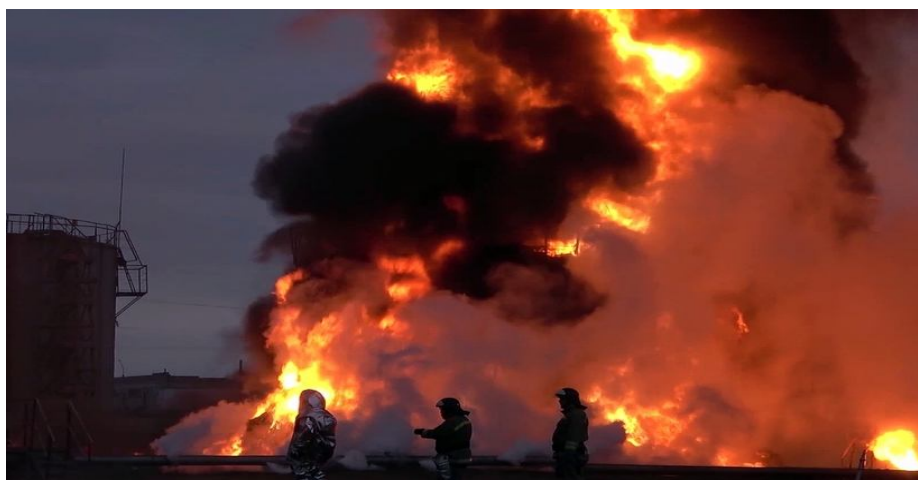
Рисунок 4 Горящая нефтебаза в Луганске

Таким образом при сжигании всего топлива образуется: 3090350 \times 2,35 = 9348263 т \text{CO}_2 . Объем газа при нормальных условиях при плотности \rho = 1,98 кг/м 3 составит 4730000000 м 3 , но если привести к значениям размерностей ПДК, то объем увеличится на 2 порядка. Получим 473 км 3 . Наряду с углекислым газом при сгорании топлива выделяется большое количество са-