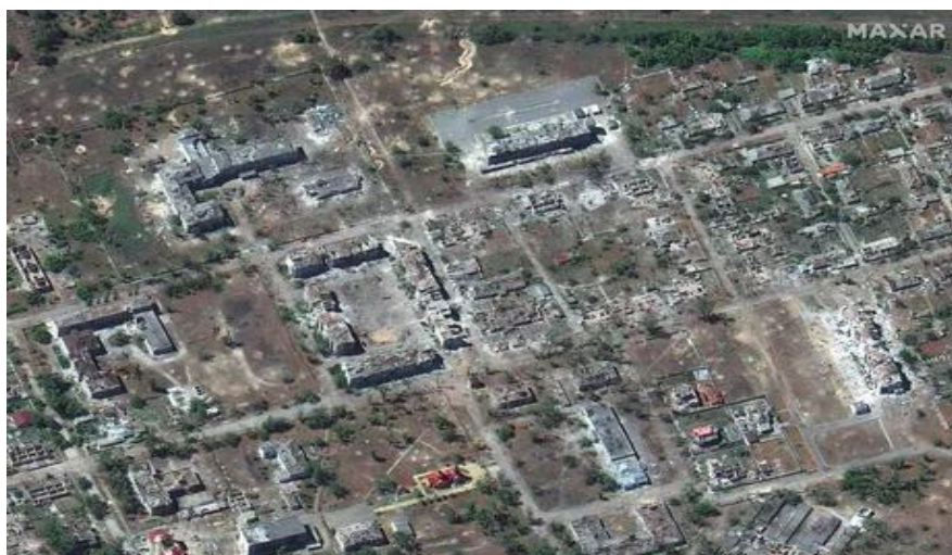
Рисунок 9 Освобожденный поселок

По очень грубым прикидкам, суммарная площадь освобожденной городской застройки составляет 1000 км 2 с характерными разрушениями, приведенными на рисунке 10. Много объектов восстановлению не подлежит. Масса строительного мусора исчисляется миллионами тонн (разрушено и повреждено до