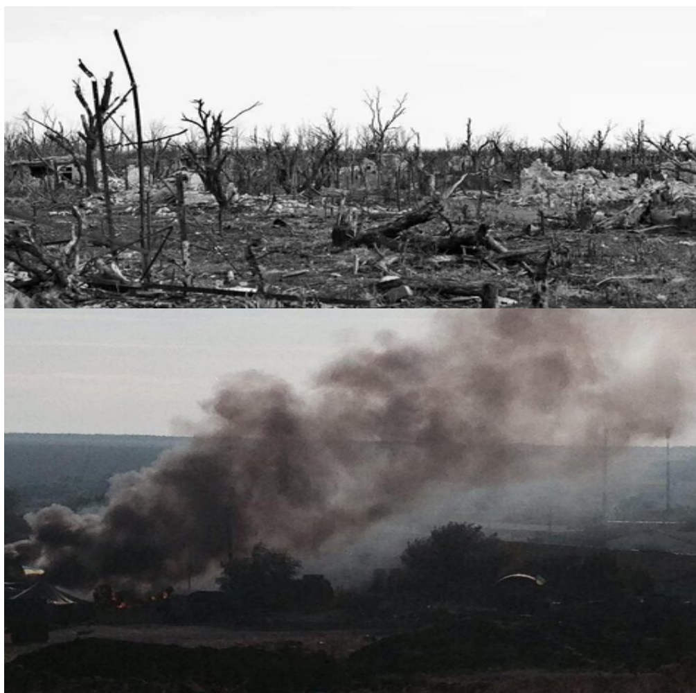
Рисунок 11 Леса под Кременной