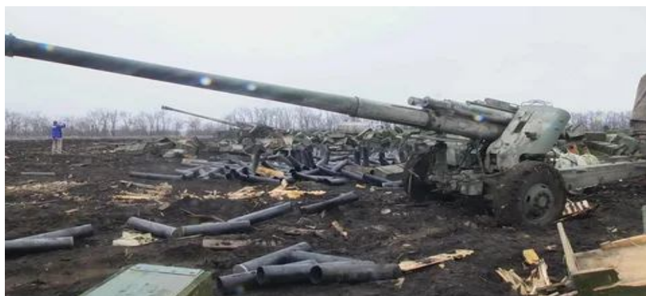
Рисунок 6 Боевая работа