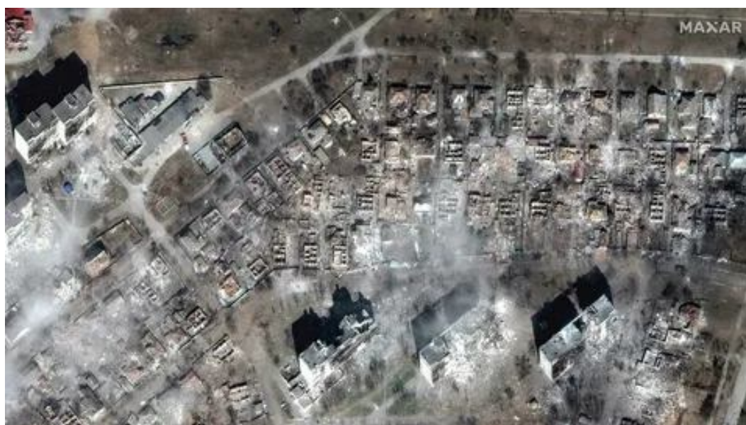
Рисунок 8 Освобожденный Мариуполь