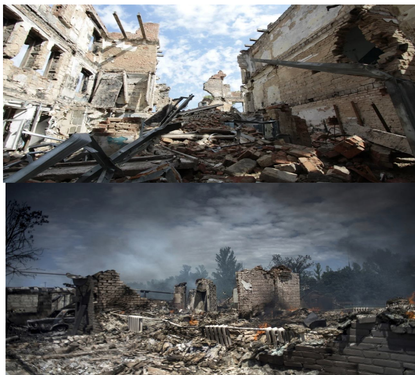
Рисунок 10 Разрушенные жилые дома

По данным [11] в зону боевых действий попали более 2700 км 2 лесов, при этом не менее трети их пострадали от вырубки, пожаров, порчи, боевых действий и уничтожения (рис. 11).