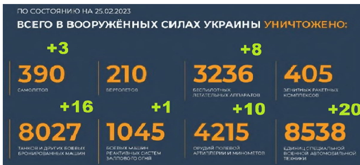
Рисунок 1 Официальная сводка МО РФ о потерях ВСУ за год СВО

Исследованиями установлено, что показатели содержания в воздухе отдельных веществ существенно превысили допустимые нормы концентрации. Исследование выполнено с использованием данных автоматизированной системы мониторинга окружающей среды Луганской области. Во время обстрелов г. Счастье с третьей декады июля по третью декаду августа в воздухе значительно увеличилась концентрация оксидов серы, азота и углерода. При этом количество оксидов серы и азота значительно превысило пределы допустимой концентрации: 13 августа — в 5 раз, а 14 августа — в 8 раз. Превышение концентрации в воздухе оксидов серы, углерода и азота является угрозой для здоровья населения и зеленых насаждений, окружающих город.