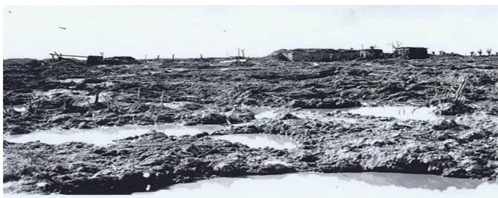
Рисунок 7 Поле боя